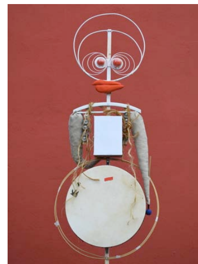
Marionnette style marotte avec 3 possibilités de production sonore : La bouche (voix du musicien) : actionnée par l'intermédiaire de la main du musicien. Le corps : son de la marotte qui tape sur le sol Les bras : le son de la marionnette qui tape sur elle-même